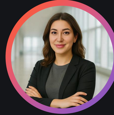
Av. Hacer Furkan Bağ

Legal Counsel & Social Security Consultant